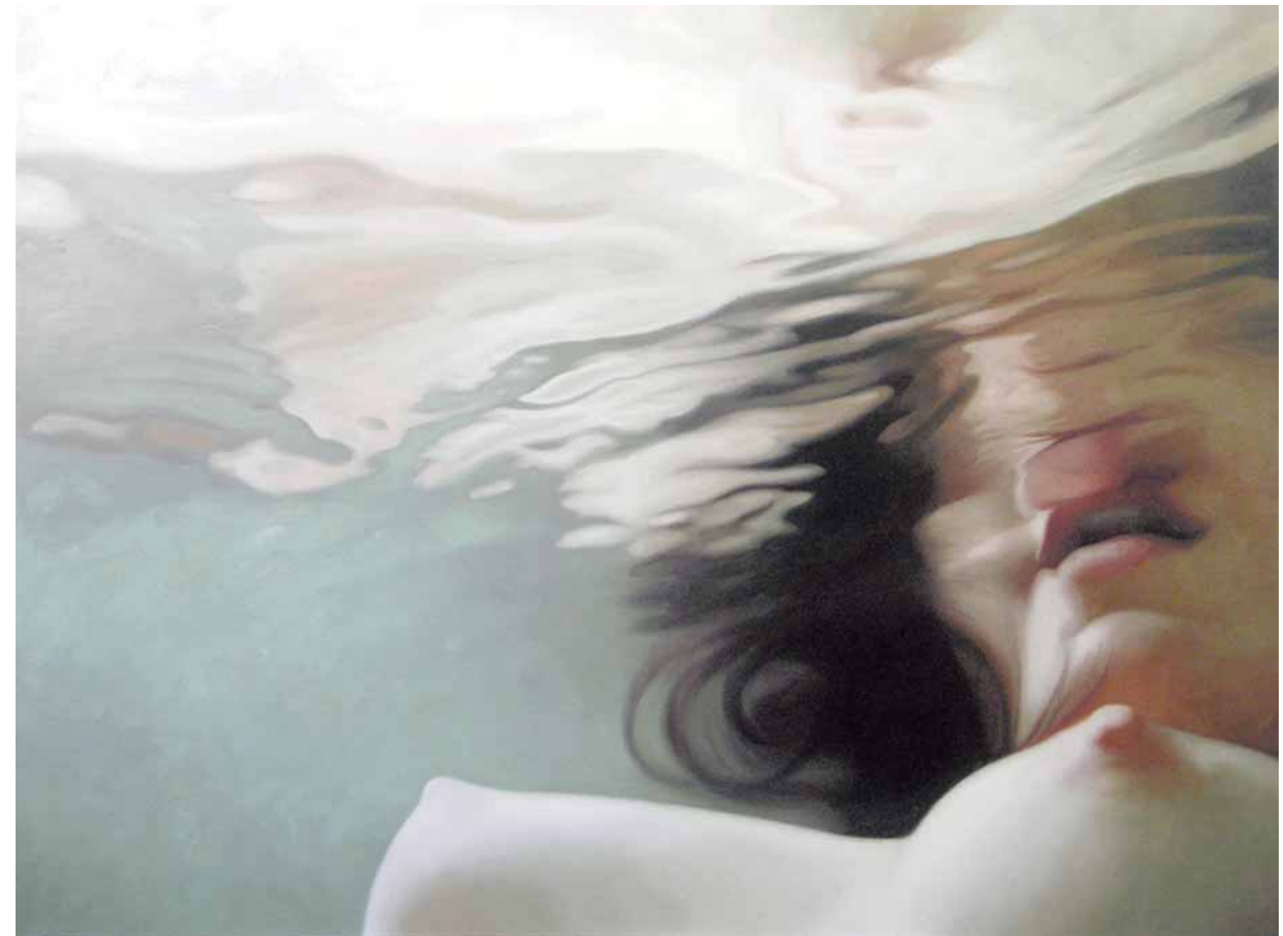
Links: CHROME 72x54, oil on linen, 2006, courtesy DFN Gallery, New York / Boven: LIQUID 42x56, oil on linen, 2006, courtesy DFN Gallery, New York