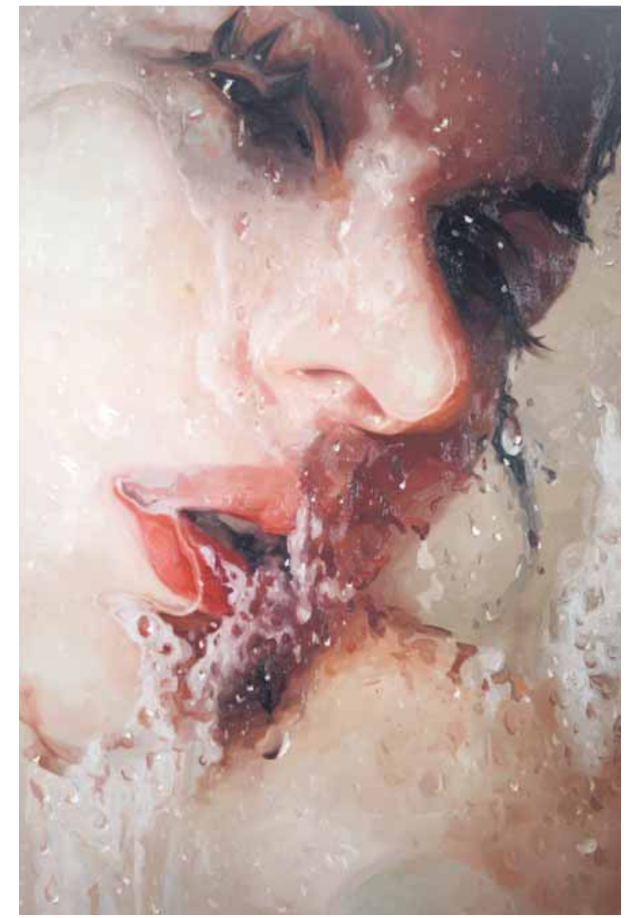
LOOK, 42x28, oil on linen, 2010, courtesy DFN Gallery, New York

Het was haar tekenleraar op de basisschool die haar talent voor 'binnen de lijntjes kleuren' ontdekte en Monks aanraadde 'later als ze groot was' naar de prestigieuze New York Academy of Arts te gaan. En zo geschiedde. In 2001 studeerde ze daar cum laude af en inmiddels – nog maar eenendertig is ze – ontvangt ze jaarlijks prijzen voor haar werk en is ze aardig op weg naar de top. Vermeer's Het meisje met de parel zou er een geduchte concurrent bij hebben als het werk van Monks in de Gouden Eeuw tot stand was gekomen.